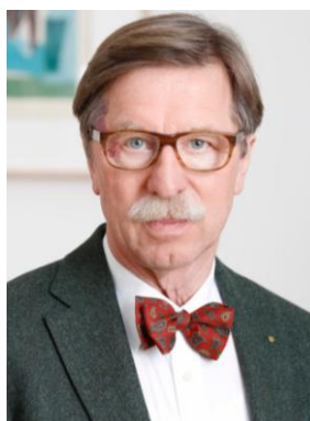
Chlodwig FRANZ © privat