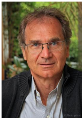
Hermann Stuppner

Für die redaktionelle Berichterstattung stellen wir Ihnen diese Bilder gerne honorarfrei zur Verfügung. Sie finden sie in drucktauglicher Qualität auf dem beiliegenden USB-Stick.