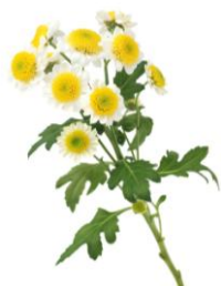
Mutterkraut (freigestellt)