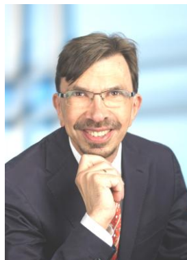
Christian Wöber