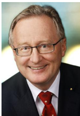
Rudolf Bauer