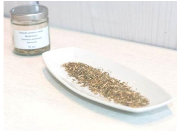
Mutterkraut in getrockneter Form